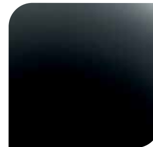
Mica Shadow Black bez dopłaty lakier specjalny