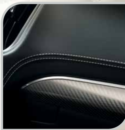
Obszyta skórą deska rozdzielcza standard