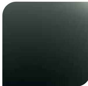
Magnetic Grey bez dopłaty lakier metalizowany