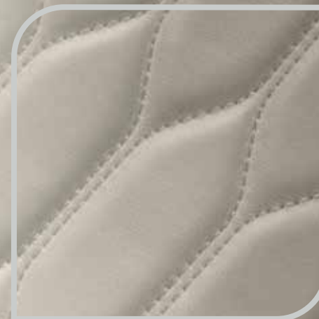
Tapicerka skórzana Lux w tonacji Cashmere bez dopłaty