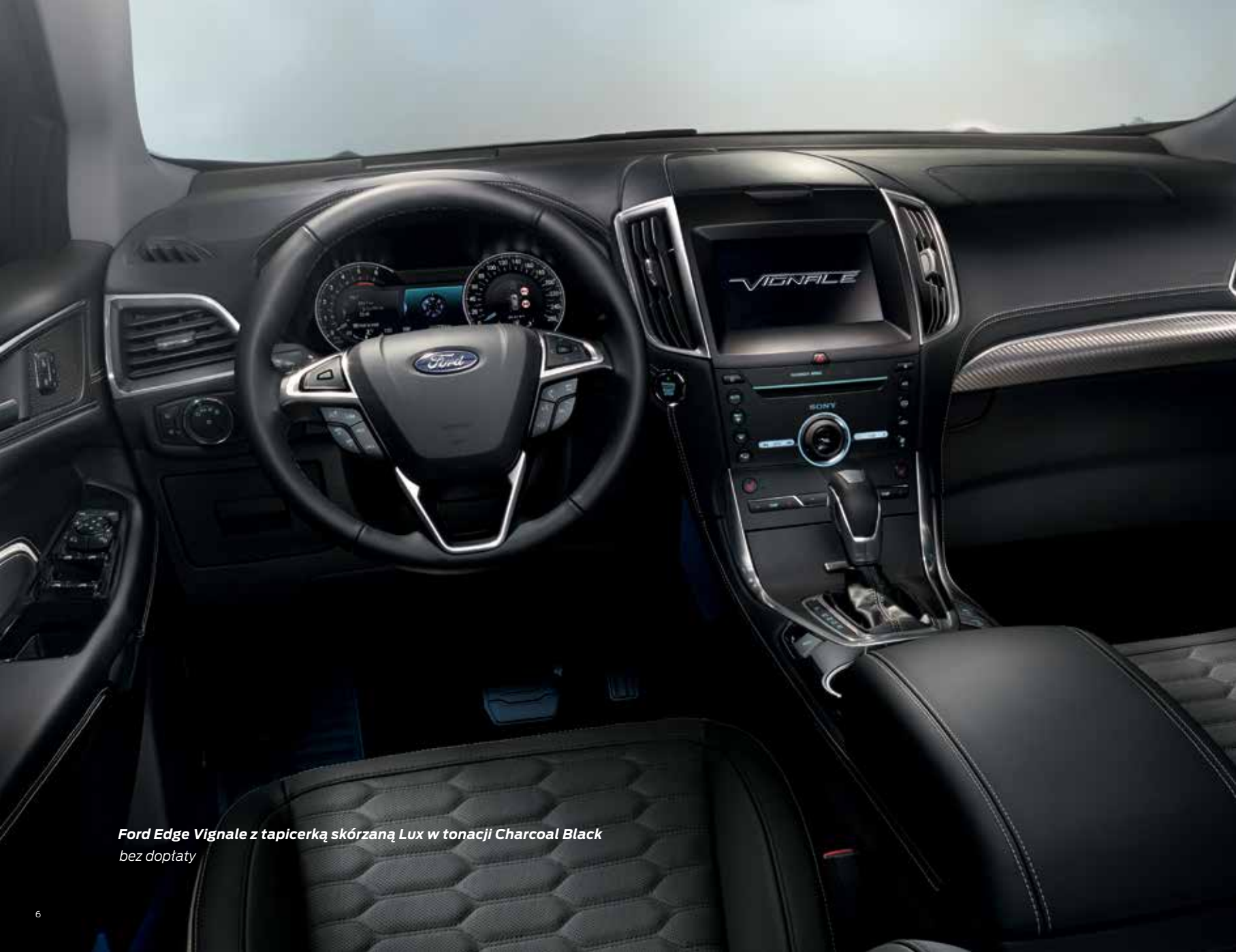
Ford Edge Vignale z tapicerką skórzaną Lux w tonacji Charcoal Black bez dopłaty