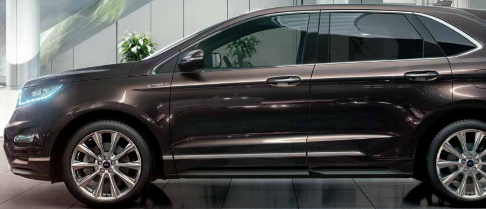
Ford Edge Vignale z 20" obręczami kół ze stopów lekkich bez dopłaty