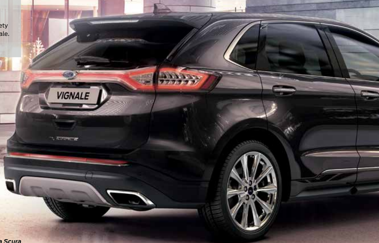
Ford Edge Vignale w kolorze Ametista Scura opcja

Ekskluzywny wygląd podkreśla unikalny kolor Ametista Scura - z palety zarezerwowanej tylko dla wersji Vignale.