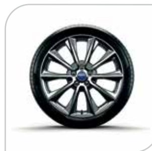
Koło dojazdowe - mini z 17" obręczą stalową standard