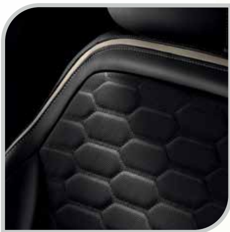
Tapicerka skórzana Lux w tonacji Charcoal Black bez dopłaty